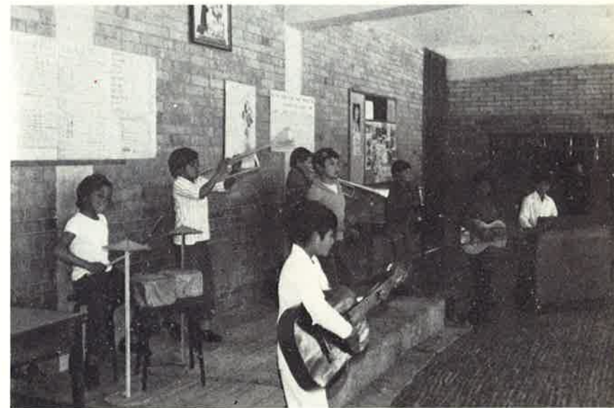
L'orchestrina dei ragazzi di Tunja infonde allegria in una giornata di festa