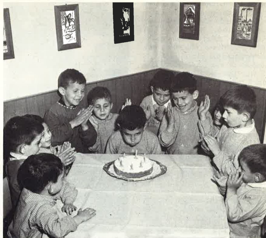
Si festeggia un compleanno