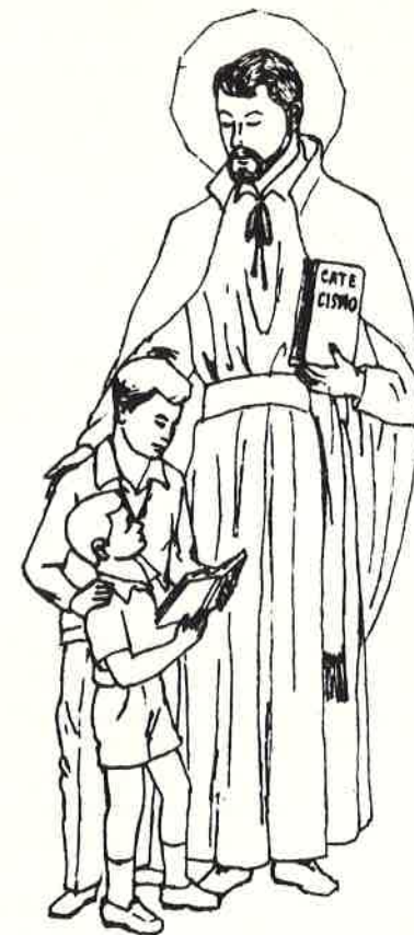
San Girolamo Emiliani "Padre delle opere e dei poveri"

Grande dono, quindi, perché ci offre la possibilità di partecipare al bene spirituale che, da San Girolamo ad oggi, come fiume è entrato nel mare della Chiesa di Cristo.