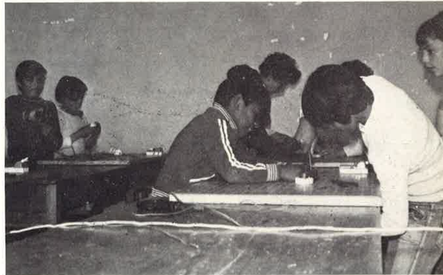
Alunni della Scuola Professionale di Tunja in addestramento