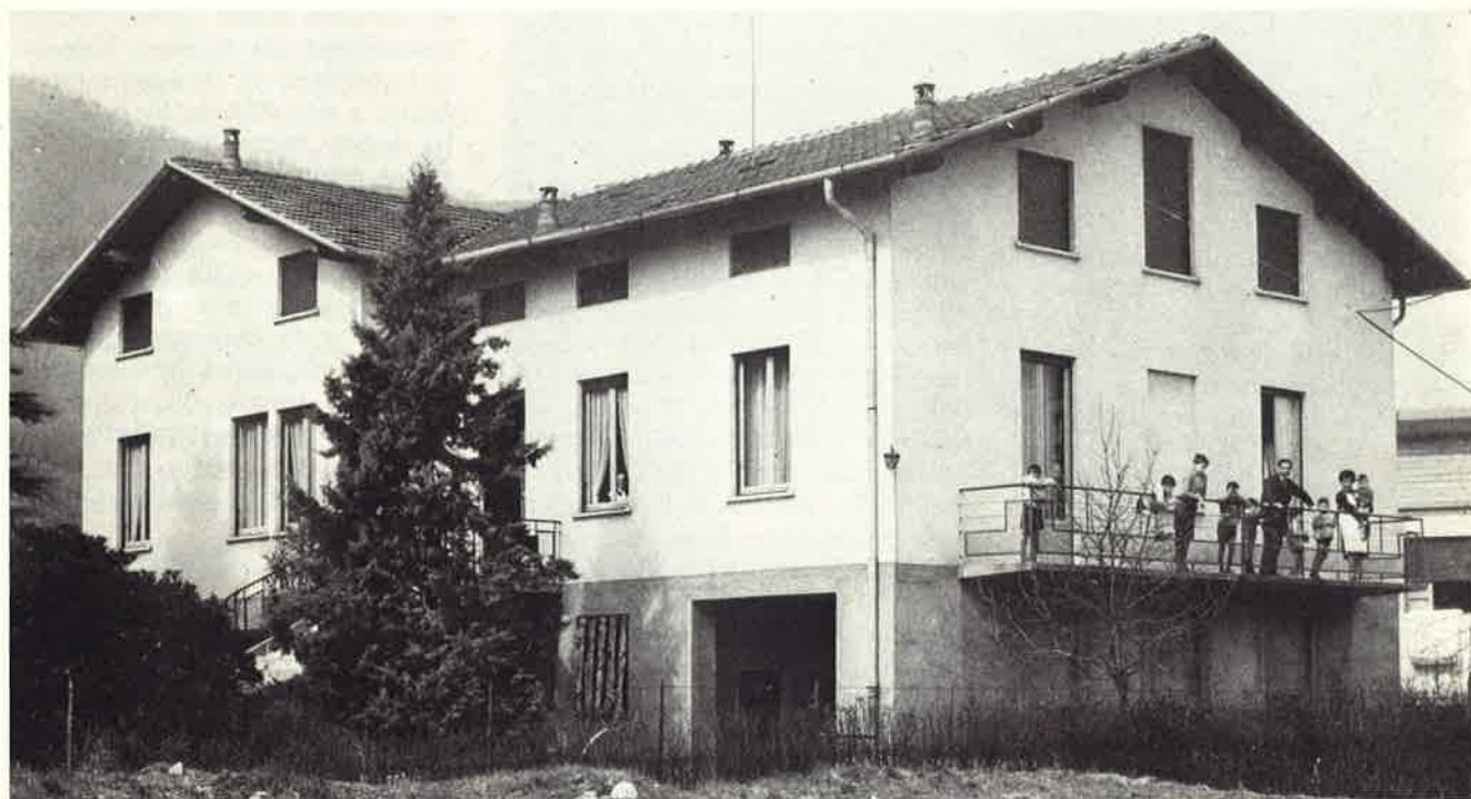
"Casa Alber" di Olginate

un modello a cui guardare un esempio da imitare