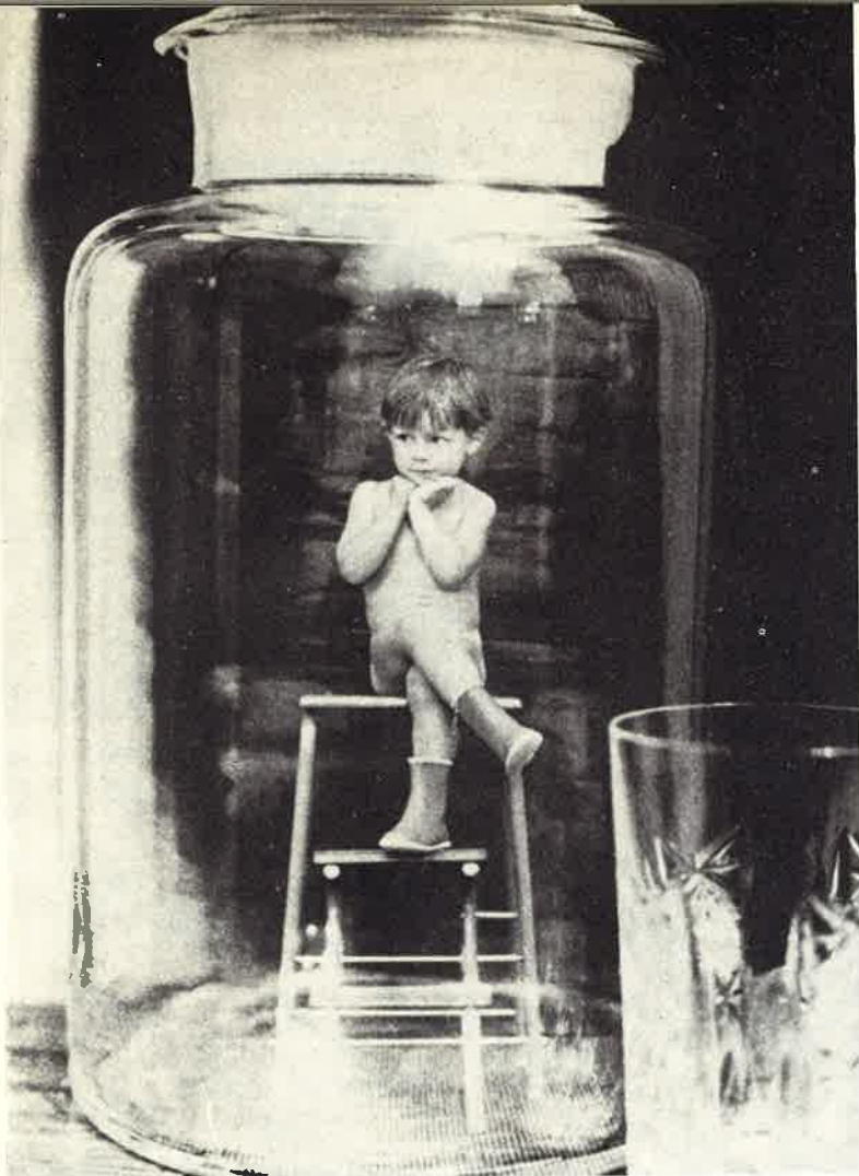
« Non sono un "pezzo" da museo da contemplare, ma una creatura da salvare! »