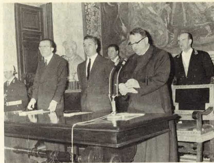
La lettura del telegramma del S. Padre

Prima di prendere brevemente parola per porgere il mio doveroso ringraziamento, mi è sentito leggere il telegramma del Santo Padre: