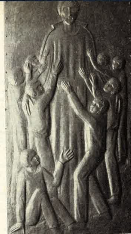
Pala d'altare di Lanusei