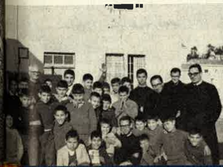
Visita a Lanusei