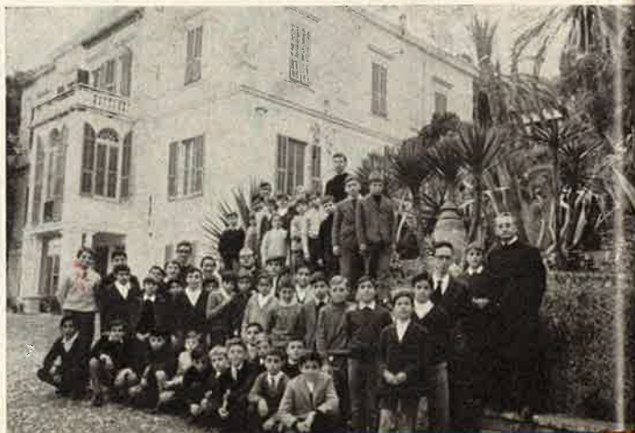
I giovanetti dell'Istituto Gilardi a Vallecrosia.

MILANO. ISTITUTO USUELLI. Festa di S. Girolamo. Il giorno 9 febbraio è stato solennemente commemorato il Transito di S. Girolamo nella chiesa parrocchiale dell'Incoronata vicina all'Istituto. Vi hanno partecipato tutti gli alunni interni ed esterni. Ha celebrato la S. Messa con discorso