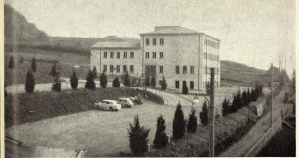
Somasca: Il nuovo Istituto per Orfani

DIREZIONE - AMMINISTRAZIONE PIAZZA S. ALESSIO, 23 - ROMA - Pubblicazione mensile per gli amici dei Padri Somaschi - Abbonamento annuo L. 1.000 - Sostenitore L. 2.000 - c.c.p. 1/41191 - Curia Generalizia PP. Somaschi - Piazza S. Alessio, 23 - Roma Dirett. Responsabile: Giovanni Gigliozzi - Sped. in abb. postale - Gruppo IV Autorizzazione del Tribunale di Roma n. 6768 (5 marzo 1959) - Tipografia Mariapoli - Grottaferrata (Roma)