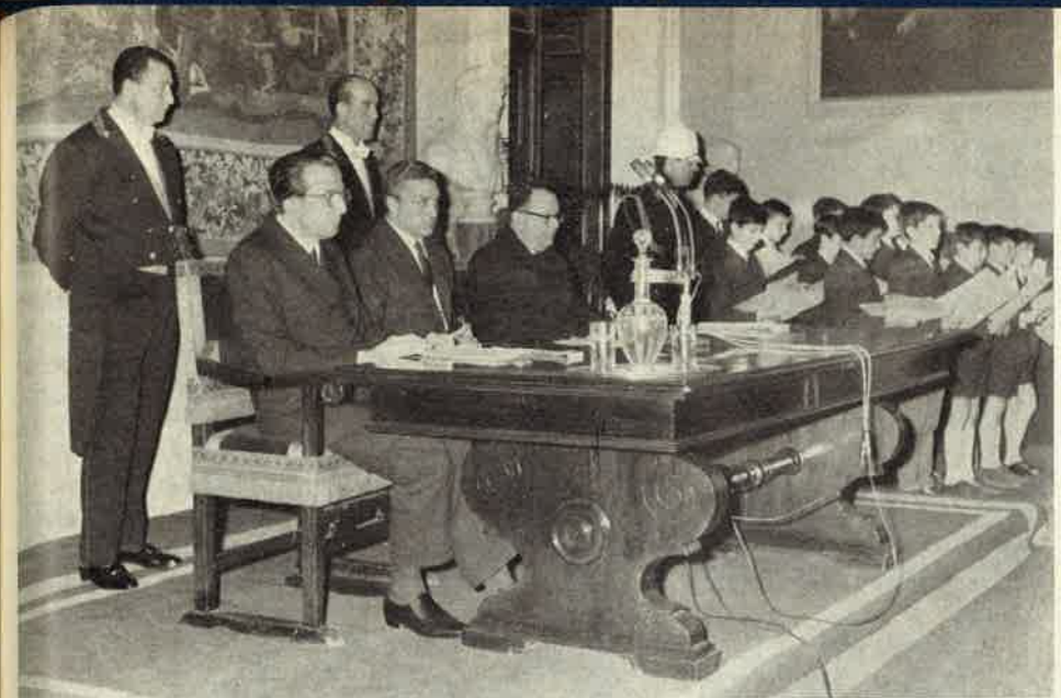
I piccoli cantori

In rappresentanza dell'On.le Sindaco, assente da Roma essendosi dovuto recare a Monfalcone per il varo del primo sommergibile della nuova flotta italiana ed intitolato all'eroe romano Enrico Toti, porge