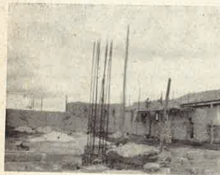
Le fondamenta della nuova Chiesa

Auguriamo loro ogni successo e godiamo di sapere che amici dall'Italia hanno fatto avere per il santo Natale aiuti concreti. Quella popolazione, per quanto sia apatica di indole e costumi, si è mostrata oltremodo contenta dell'arrivo e del lavoro apostolico dei Figli di S. Girolamo.