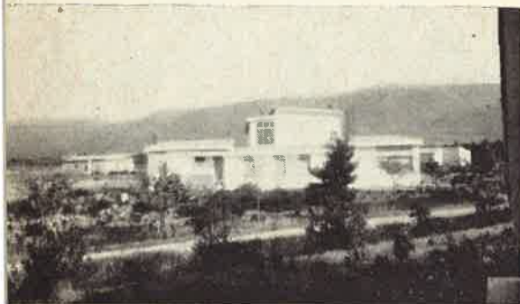
S. Anna di Oristano

VISITA IN SARDEGNA. Il rev.mo P. Generale accogliendo l'invito dei nostri Padri che da poche settimane hanno assunto la guida di tre parrocchie nella piana di Oristano ha trascorso il S. Natale in mezzo a loro, aiutandoli anche nel sacro Ministero.