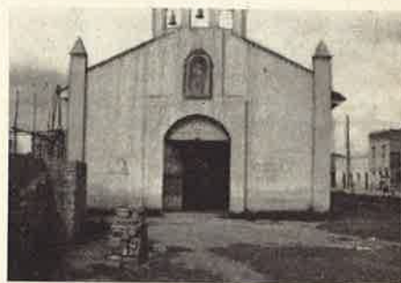
La Chiesa baracca esistente

si sono persi di coraggio, nonostante la miseria spaventosa e la turba — è la parola esatta — di ragazzi che gironzolano per le vie, che costituiscono la gioventù abbandonata dei nostri tempi verso i quali si sarebbe indirizzata l'opera di S. Girolamo.