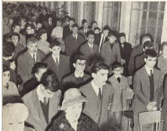
Collegio Sgariglia - Foligno Parenti ed alunni alla cerimonia della Premiazione